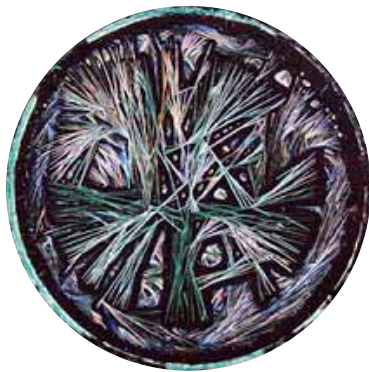
Konventionelt forædlet hvedesort