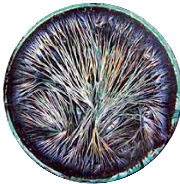
Biodynamisk forædlet hvedesort