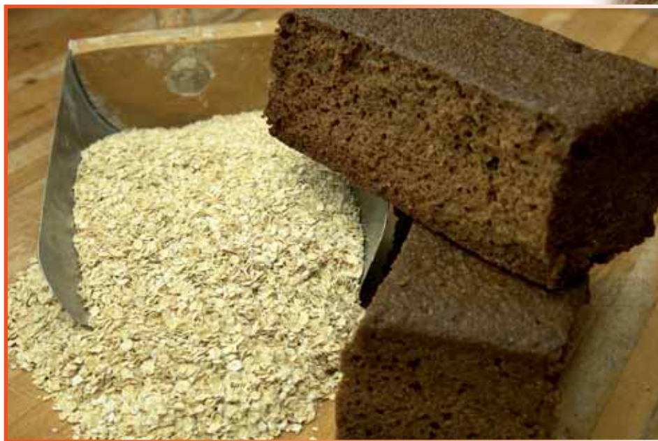
Vi dyrker i dag stærkt forædlede hvedesorter, som et stigende antal mennesker ikke tåler, fordi de ikke kan nedbryde dem helt.